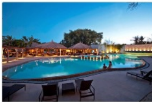
マリバゴブルーウォーター