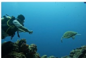
モアルポアルツアー