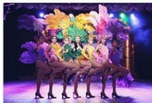
アメイジングショー(ディナー付)