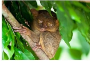
ポホール島日帰りツアー