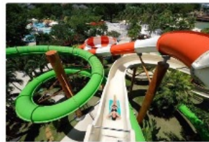
Jパークアイランド