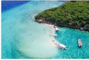
マクタン島アイランドホッピング

平日アクティビティ 放課後アクティビティ 日帰りアクティビティ 泊二日アクティビティ ホテルダイユース アウトドア インドア 大人向け 子供向け 大自然 スポーツ アミューズメント 歴史・宗教 ショッピング 空演・ボランティヤ活動