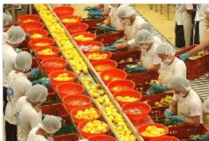
ドライマンゴー製造工場見学