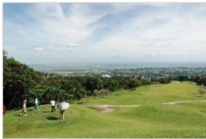
王様ゴルフツアー

日帰りアクティビティ ホテルダイユース アウトドア 大人向け 子供向け アミューズメント