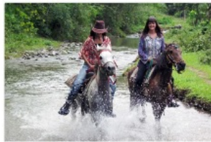
一日乗馬体験(川下り)