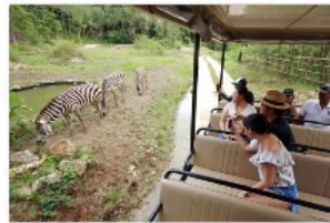
セブサファリ&アドベンチャー