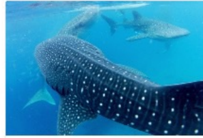
ジンバイザメウォッチング