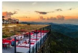
トップス山岳景観巡り