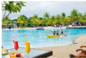
プランテーションベイ